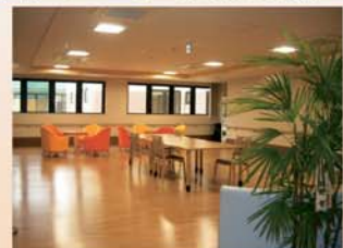
《2階ふれあいホール》

3月11日の被災でガソリンの節約を考えられてなのか見学者が予想より少ない状況でした。そんな中でも見学にお出で頂いた皆様には感謝申し上げます。有難うございました。