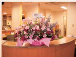
《2階スタッフステーション》

《個室対応 全室無料》テレビ・電話・ソファ・冷蔵庫・イス テーブル・ロッカー・茶箆筒・チェスト・床頭台を完備