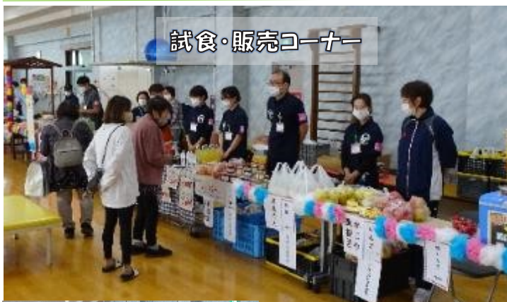
試食・販売コーナー