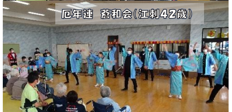
厄年連 蒼和会(江刺42歳)