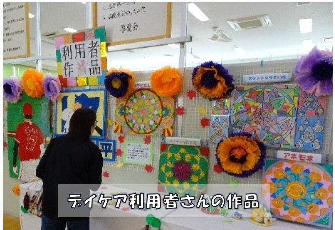
デイケア利用者さんの作品