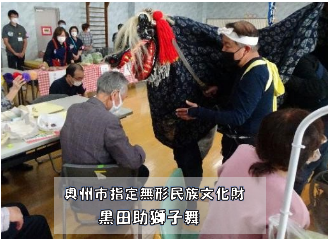
奥州市指定無形民族文化財 黒田助獅子舞